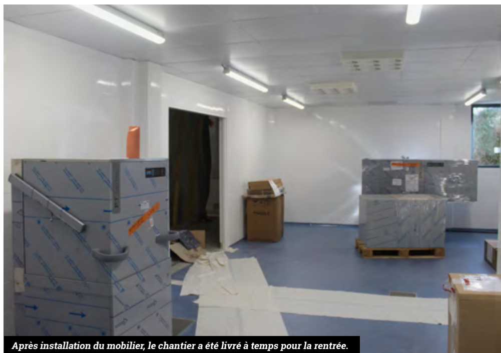
Après installation du mobilier, le chantier a été livré à temps pour la rentrée.