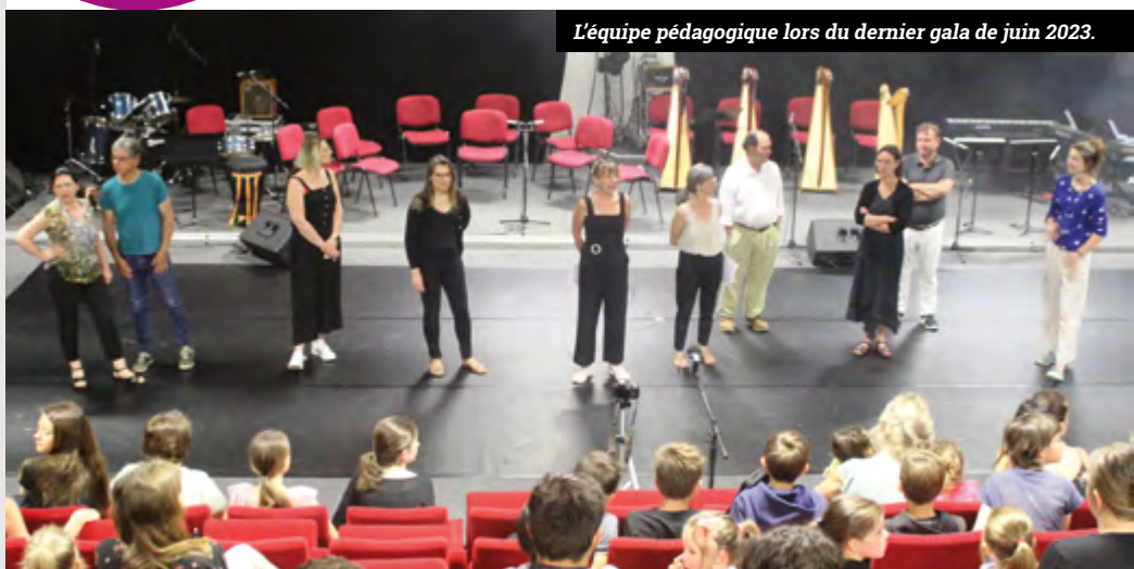
L'équipe pédagogique lors du dernier gala de juin 2023.