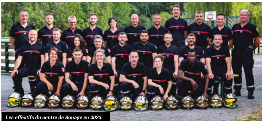
Les effectifs du centre de Bouaye en 2023.

Comptant actuellement un effectif de 33 sapeurs-pompiers (27 hommes et 6 femmes), le centre de secours et d'incendie de Bouaye est toujours à la recherche de nouveaux volontaires. « Il suffit d'avoir plus de 18 ans et de résider à moins de 6 minutes de la caserne pour prétendre rejoindre les effectifs boscéens » ajoute le lieutenant Bruno Hamelin. C'est à l'occasion de la sortie de leur ouvrage que l'amicale des sapeurs-pompiers organise une journée portes-ouvertes le samedi 4 novembre à 11h à la salle Eugène Lévêque. Au programme : dédicaces du livre par son auteur, exposition et animations. « J'invite les Boscéens à se procurer ce livre, disponible à la médiathèque à compter de décembre et ainsi témoigner de notre reconnaissance à l'égard de ces hommes et femmes courageux, au service de l'intérêt général et de la sécurité sur notre commune » précise Jacques Garreau, maire de Bouaye. ●