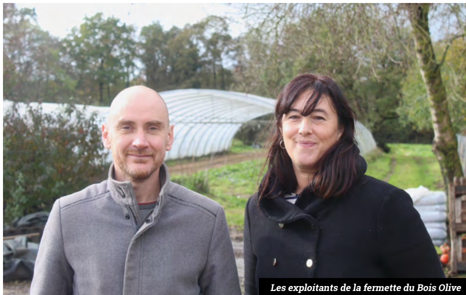
Les exploitants de la ferme du Bois Olive

Le 9 novembre dernier fut signée une convention unissant la Ferme du Bois Olive, la Ville de Bouaye, l'association « Une famille un toit 44 (UFUT) », « Terre de lien », la coopérative « Passeurs de terres » et Nantes Métropole.