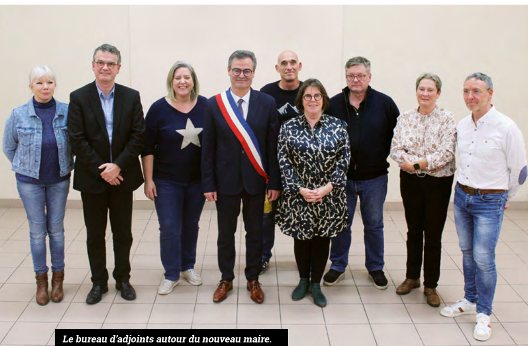
Le bureau d'adjoints autour du nouveau maire.