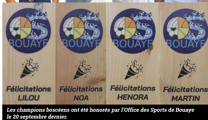
Les champions boscéens ont été honorés par l'Office des Sports de Bouaye le 20 septembre dernier.