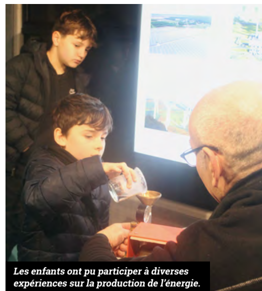
Les enfants ont pu participer à diverses expériences sur la production de l'énergie.

Le Tech'nomad est un bus aménagé qui vient à la rencontre des scolaires et du grand public pour sensibiliser à la technologie et éveiller la curiosité scientifique. Créé par L'Institut Universitaire Technologique de Nantes, ce bus pas comme les autres sillonne la région pour proposer des expériences aussi amusantes qu'inédites sur le thème de l'énergie, de la mobilité et du mouvement. Le jeudi 22 février dernier, il a fait une halte à l'école élémentaire Maryse Bastié pour le plus grand plaisir des CM1 et CM2 qui ont participé, de 10h30 à 15h30, à 4 ateliers thématiques mis en place par des enseignants et médiateurs de l'IUT. Reportage vidéo sur www.bouaye.fr ●