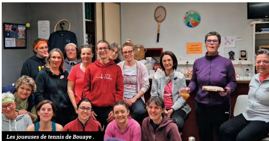
Les joueuses de tennis de Bouaye .

Le Tennis Club de Bouaye veut promouvoir le tennis féminin et œuvre depuis plusieurs années pour amener les femmes au sport. Elles sont sous représentées au niveau national mais aussi régional ; au niveau local et le club en a fait un axe majeur de son « projet club ». Au-delà de la pratique du tennis, ce sont des animations, soirées et moments de partage exclusivement dédiés aux femmes qui sont organisés au TCB. Son objectif : allier sport et convivialité. La soirée tennis féminin du 5 mars, largement révisité par les participantes, fut une réussite (notre photo). Les équipes Femmes et Filles permettent à chacune de trouver sa place en compétition. Avec