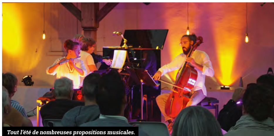
Tout l'été de nombreuses propositions musicales.

Comme chaque été, la médiathèque met en place 3 boîtes à livres accessibles à tous, parc des Droits de l'Homme et du citoyen, parc de la Mévellière et place des Echoppes. Ces boîtes permettent aux lecteurs de belles découvertes littéraires, au gré de leurs déambulations ; les livres doivent y être remis après lecture pour en faire profiter le plus de monde possible. Des sacs-surprises contenant livres et revues préparés par vos bibliothécaires sont aussi à emporter à lire à la maison. Il y en aura pour tous les âges : enfants, ados et adultes.