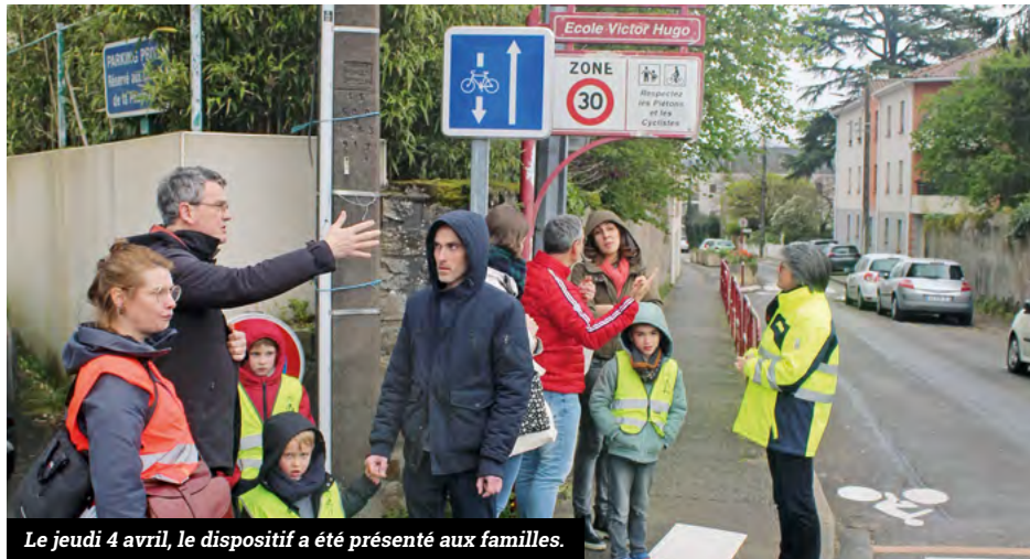
Le jeudi 4 avril, le dispositif a été présenté aux familles.

A partir du 13 mai 2024 et jusqu'à la fin des cours le 5 juillet, va être expérimentée la fermeture d'une portion de la rue de la gare au droit de l'entrée de l'école. L'objectif est de sécuriser et d'apaiser la circulation des élèves aux abords de l'école. Elle sera fermée aux véhicules les jours d'école, aux horaires d'entrée et de sortie, de 8h15 à 8h45 et de 16h15 à 16h45.