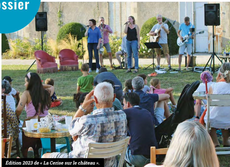
Édition 2023 de « La Cerise sur le château ».