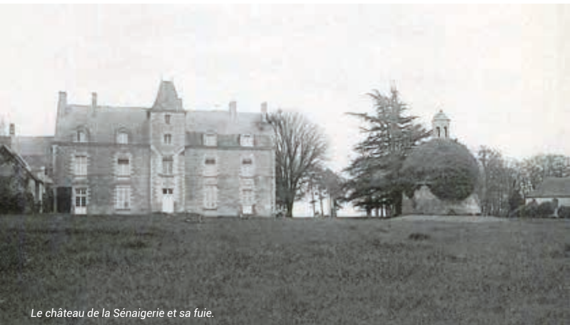
Le château de la Sénéagerie et sa fuie.

Dès 1580, le Recteur administrait la paroisse et tenait les registres d'état civil. Le clergé occupa cette fonction jusqu'à la Révolution Française. Le premier maire fut nommé en novembre 1792.